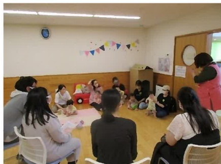
プレママパパ見学会…赤ちゃんのつどいに参加された親子との交流