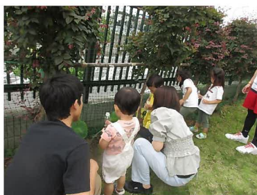
さといも成長を観察する