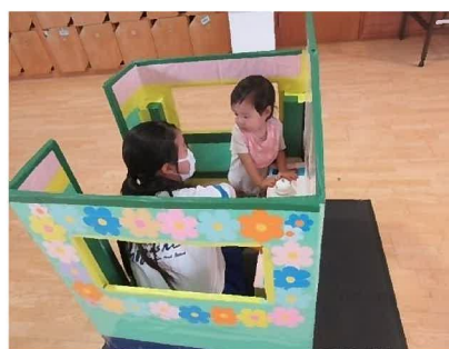
夏のボランティア体験 ソーレ