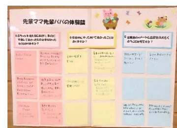
先輩ママパパの体験談ボード