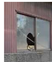
窓が割れた 管理不全空家