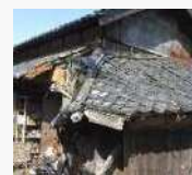
緊急代執行を要する 崩落しかけた屋根