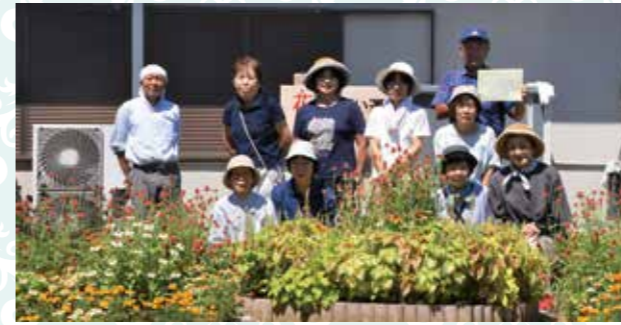
殿山町自治会ボランティアの皆さん

自治会館敷地内にある殿山町自治会の花壇は、昨年の春から花壇を区画分けしたそうで、花壇内部まで立ち入り花を見ることが出来るガーデンです。