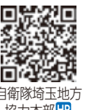
自衛隊埼玉地方協力本部HP