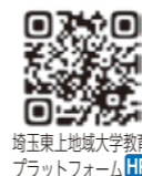
埼玉東上地域大学教育プラットフォームHP