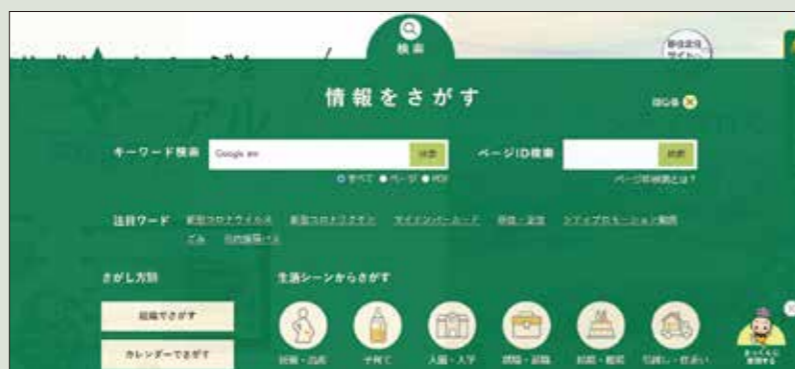
パソコンでの見え方