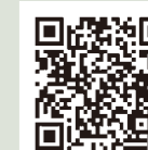
広報ひがしまつやま市HP

～広報ひがしまつやま最新号を電子ブックで見る場合～ 右の二次元コードのページから「広報ひがしまつやま最新号はこちら」「〇年広報ひがしまつやま〇月号ウェブブック」の順に進むことで、見ることができます。