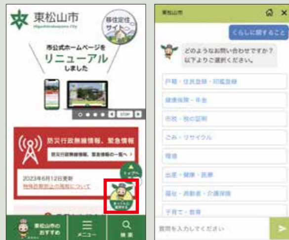
スマートフォンでの見え方

市マスコットキャラクターのまっくんが24時間365日、会話形式で質問に答えます。