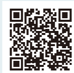
シティプロモーション 動画(YouTube)