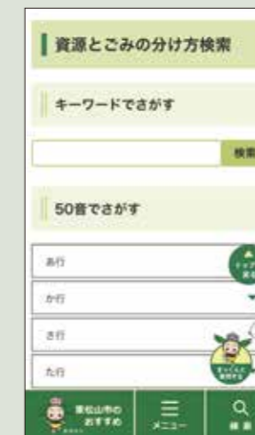
スマートフォンでの見え方