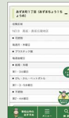
スマートフォンでの見え方