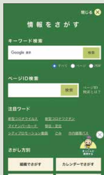
スマートフォンでの見え方

画面下部に検索ボタンを用意しました。キーワード検索等ができ、多くの情報が掲載されている市公式ホームページでお目当ての情報を探すにはとても便利です。