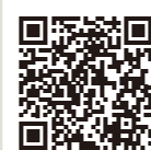
検索機能の使い方市HP