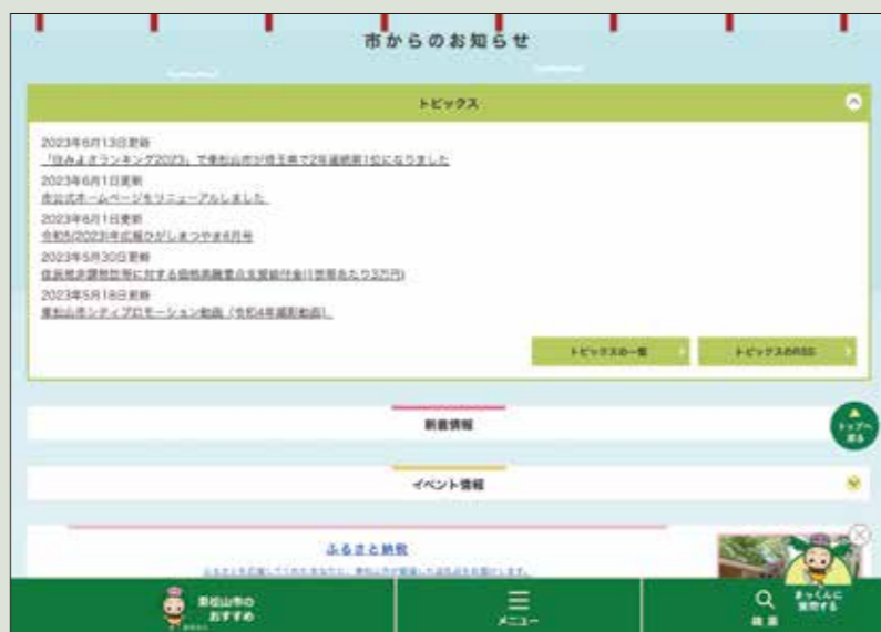
タブレットでの見え方