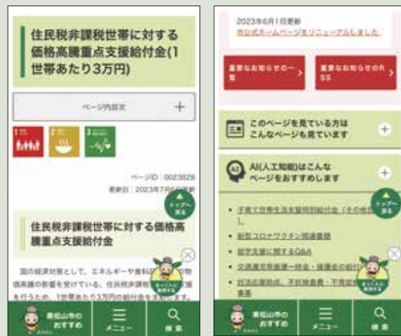
スマートフォンでの見え方

※スマートフォンでは記事の下に、パソコンではページ記事の左又は右に表示されます。