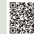
資源とごみの分け方・収集日検索 市HP