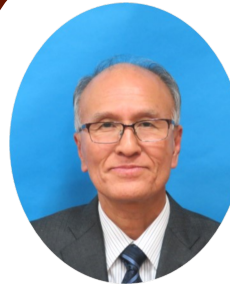
民児協連合会副会長 松山第二地区民児協会長