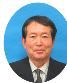
民児協連合会副会長 大岡地区民児協会長

今後も、地域の皆さんの様々な要望に応えられるよう、これらの活動に日々頑張っており、引き続きのご理解とご協力をお願いいたします。