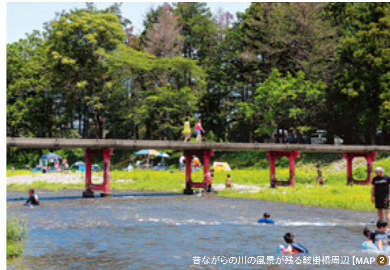
昔ながらの川の風景が残る鞍掛橋周辺【MAP②】