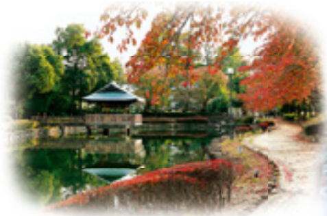
まちなかの憩いの場、上沼公園(左)【MAP⑥】 と下沼公園(右)【MAP⑦】