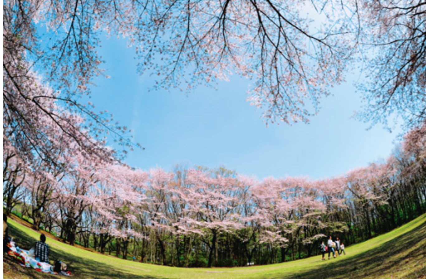
芝生広場の周りを囲む桜(岩鼻運動公園)【MAP④】

生い茂る森、清らかに流れる川、 澄み渡る空気、緑あふれる公園 比企丘陵の豊かな自然に囲まれた東松山市は 四季折々の彩りにあふれています。