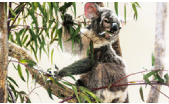
コアラやペンギンなどに間近に会える県子ども動物自然公園【MAP⑧】