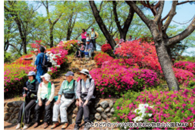
色とりどりのツツジが咲き乱れる物見山公園【MAP①】