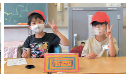
受付がんばったよ