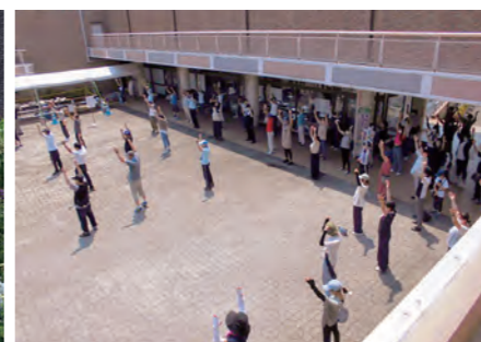
ラジオ体操指導者講習会