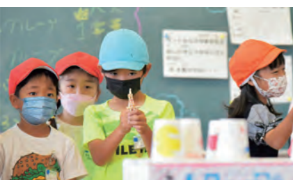
輪ゴムを飛ばす射的

6月4日(土)、市の川小学校でふれあいフェスティバルが行われました。縦割り班のチームで協力し、射的や玉運びレースなどのお店を自分たちで考え、作り上げました。当日は、主に1・2年生が呼び込みや受付、3・4・5年生がルール説明や遊びの進行、6年生が全体の見守りと低・中学年へのサポートをしていました。他のお店に遊びに行く時には、高学年の児童が低学年の児童と一緒に行動し、優しく見守る姿もありました。