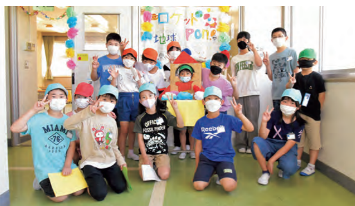
ロケットボンチーム

6月4日(土)、市の川小学校でふれあいフェスティバルが行われました。縦割り班のチームで協力し、射的や玉運びレースなどのお店を自分たちで考え、作り上げました。当日は、主に1・2年生が呼び込みや受付、3・4・5年生がルール説明や遊びの進行、6年生が全体の見守りと低・中学年へのサポートをしていました。他のお店に遊びに行く時には、高学年の児童が低学年の児童と一緒に行動し、優しく見守る姿もありました。