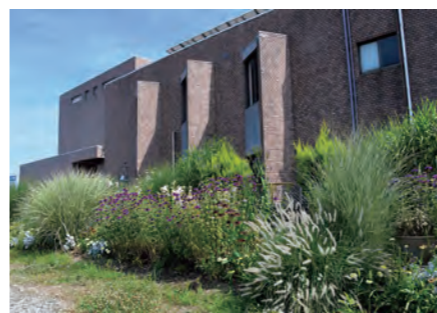
グラスガーデン(北側花壇)

※現在、新型コロナワクチン集団接種会場として使用中のため、ホール及び展示ホールの貸館を停止しています。