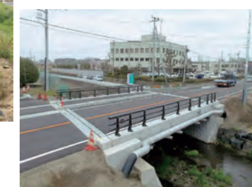
現在のの上野本橋

今でも橋長約15メートルの小さな橋ですが、東松山警察署と消防署を結ぶ大事な橋です。近くには地元新鮮野菜等を販売している東松山農産物直売所「いなほてらす」もあります。一度お出かけ際に立ち寄ってみませんか。