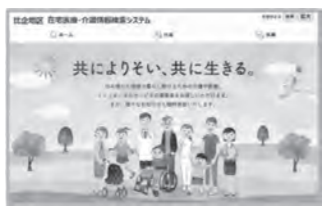
検索システム 二次元コード

病院、歯科、薬局、介護サービス事業所の情報が手軽に検索できる「比企地区在宅医療・介護情報検索システム」が市HPから見ることでできます。所在地、診療科、サービス内容などを簡単に調べられ、地図も掲載されますので、ぜひご利用ください。 問 高齢介護課 ☎ 22-7733 FAX 22-7731