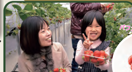
パフェを食べながら カフェで一休み。

市北部のスポットをつなぐ「みどりのみち」をお披露目。鎌倉時代に思いを馳せながら、比企氏が暮らしていたと思われる地を歩いてみませんか。