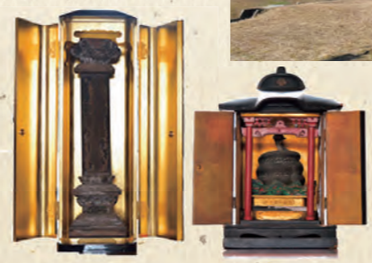
頼家の位牌(左)と蛇苦止観音像(右)。通常は公開していません。