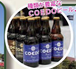
種類が豊富な COEDOビール♪

春に見頃を迎えるぼたんはもちろん、大型遊具やイベントも大人気の、一年中遊べるスポット。 ●大谷 1148-1 ☎ 81-7607 ●トイレ有●駐車場有