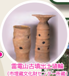
雷電山古墳出土土埴輪 (市埋蔵文化財センター所蔵)

みどりのみち巡りのスタートは、馬頭観音で道中祈願。毎年2月19日の例大祭では絵馬市が立つことでも知られる。●岡 1729 ☎ 39-0052 (妙安寺)