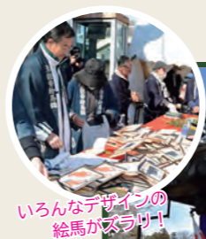
いろんなデザインの 絵馬がズラリ！