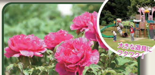
大きな遊具に ワクワク！