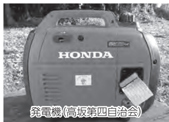
発電機(高坂第四自治会)