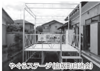
やぐらステージ(白坂町自治会)