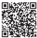
親と子どもの悩みごと相談@埼玉