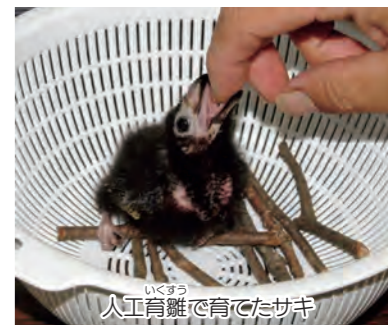
人工育雛で育てたサキ