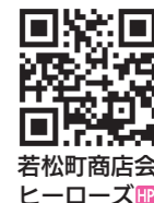
若松町商店会 ヒーローズ