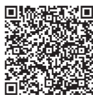
企業版ふるさと納税HP