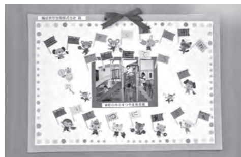
まつやま保育園の園児が書いた感謝の色紙