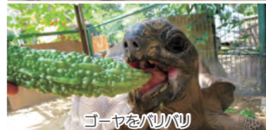
ゴーヤをバリバリ