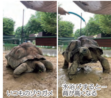
いつものゾウガメ