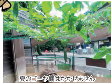
夏のゴーヤ棚はかせません