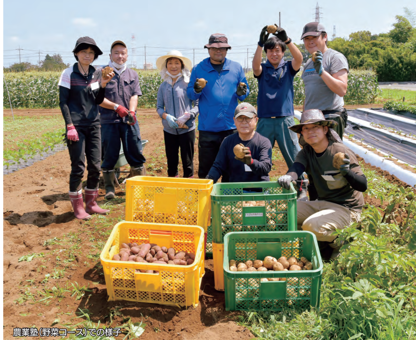
農業塾(野菜コース)での様子