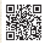
市農林公園 ホームページ