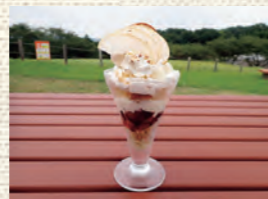
秋の限定メニュー 梨たっぷりパフェ 700円

モーニングメニュー、ランチメニュー、デザートなどを用意しています。メニューはホームページをご確認ください。