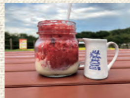
数量限定メニュー 削りイチゴ(小) 300円