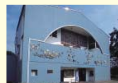
原爆の図 丸木美術館