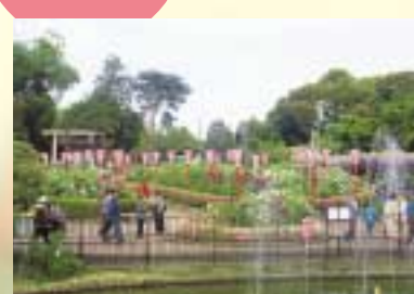
かれんな姿は、天然記念物 西本宿 カタクリ 群生地