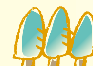
森林浴に最適な雑木林 市民の森