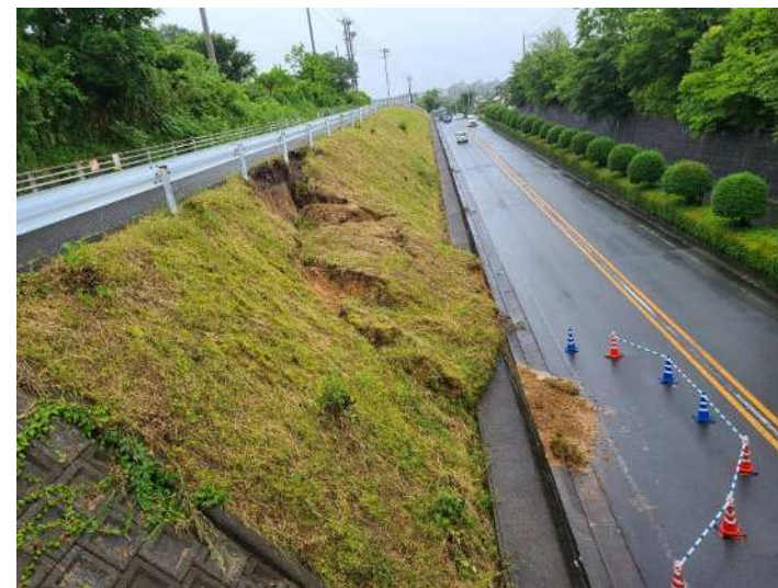
市道第66号線(大字田木)