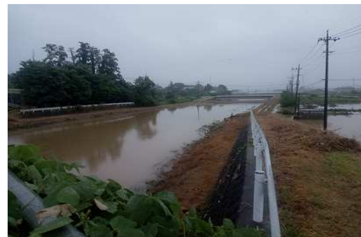
九十九川 (大字宮鼻)