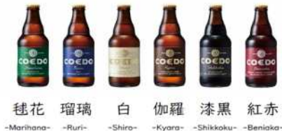
毬花 瑠璃 白 伽羅 漆黒 紅赤 -Marihana- -Ruri- -Shiro- -Kyara- -Shikkoku- -Beniaka-

COEDOの瓶定番全6種類【毬花 -Marihana-、瑠璃 -Ruri-、白 -Shiro-、伽羅 -Kyara-、漆黒 -Shikkoku-、紅赤 -Beniaka-】を楽しめる詰合せセットは、各2本ずつ入った12本セットと各4本ずつ入った24本セットの2種類をご用意しております。