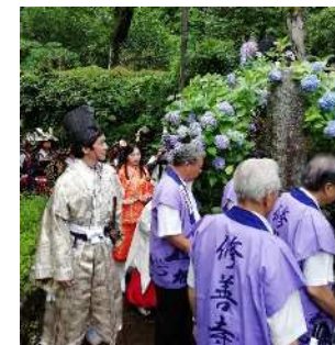
修善寺 頼家まつり (R1.7)