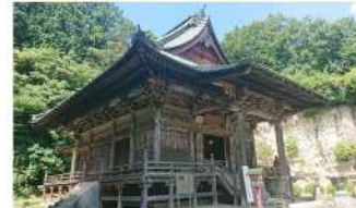
巖殿山正法寺 (いわどのさんしょうほうじ)

約1300年の歴史を持つ古刹は今でも多くの人々の信仰を集めています。秋には南無の山々が色づき、境内の大観音の美術が参拝者を出迎えます。