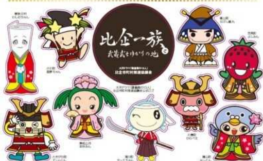
大河ドラマ「鎌倉殿の13人」比企市町村推進協議会