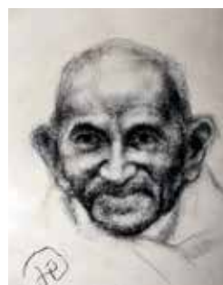
マハトマ・ガンジー