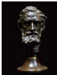
マルセル・マルチネ