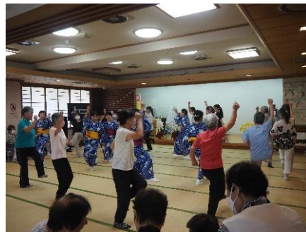
夏のスペシャルデイ (盆踊り)