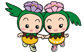
けんこう大使 まっくん あゆみん