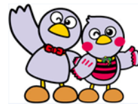
埼玉県マスコット