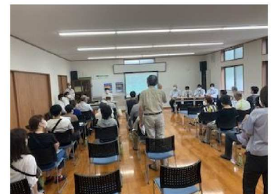
市道第6102号線 【説明会の様子】