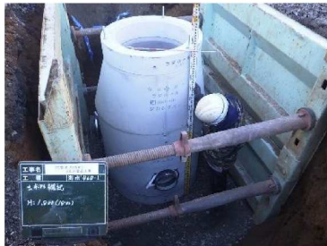
【マンホール設置状況】