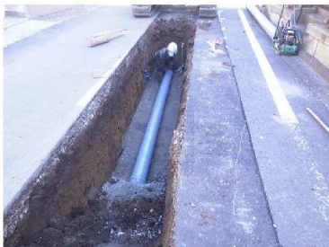
【下水道管布設状況】