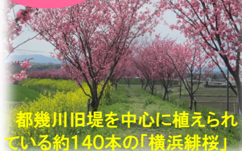
都幾川旧堤を中心に植えられている約140本の「横浜緋桜」