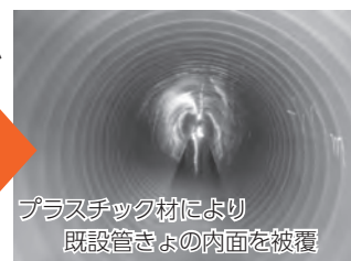
プラスチック材により 既設管きょの内面を被覆