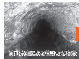
老朽化対策のイメージ