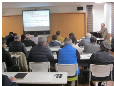
城や領地の歴史を講話

2月25日(火)野本市民活動センターで開催した歴史講座に32名が参加しました。歴史講座の内容は、平安時代から江戸時代が始まるまで関東地方を統治した戦国武将の説明や、なぜそこに城を築いたのか、河越館(やかた)から江戸城ができるまでの歴史を説明していただきました。参加者は興味深く歴史話を聞いていました。