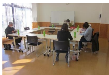
3月1日(土) 最終編集作業