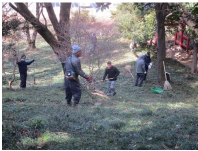
草刈り・落ち葉収集

2月22日(土) 野本市民活動センター東側にある野本将軍塚古墳の環境整備を、野本区長会、野本地区シニアクラブ連合会、遺族会野本支部、松山高校同窓会南部会野本支部のご協力を頂き、総勢47名で前方後円墳の戦没者慰霊碑がある南側を落枝や落葉の除去、一部樹木枝の伐採、草刈り等を実施しました。約1時間ほどで清掃活動は終了しました。