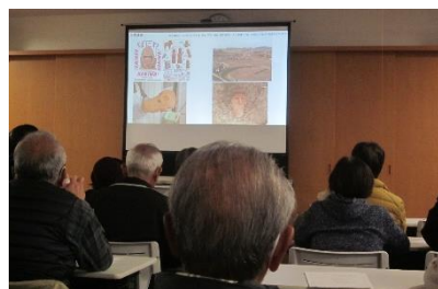
遺跡の出土や歴史を説明