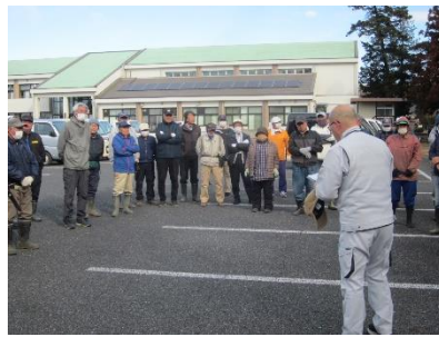
開始前に作業内容説明