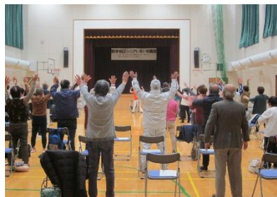
笑いヨガを体験しました。