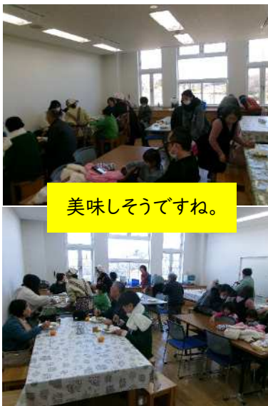
美味しそうですね。