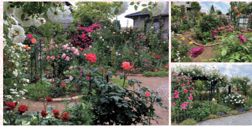
地域支援課 花いっぱい推進室 ☎21-1435 FAX22-7799

写真のとおり、今でもとてもすてきな花壇ですが、それでも「完成できていない!」と話す小澤さん。より一層きれいな花壇にしたいという思いを常に抱いているようでした。とても楽しみです。