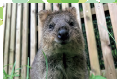
ローアングルだと笑顔に見えるらしい