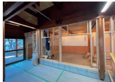
屋内展示施設はまもなく完成

クオッカ来園5周年を記念して、ぬいぐるみ(大)を抽選で3人にプレゼントします! 詳細は今月号6ページFocusをご覧ください。