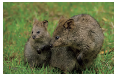
毎年赤ちゃんがうまれてます