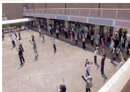
ラジオ体操指導者講習会