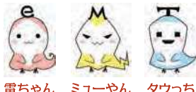
電ちゃん ミューやん タウっち