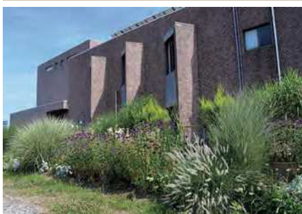
グラスガーデン(北側花壇)

※現在、新型コロナワクチン集団接種会場として使用中のため、ホール及び展示ホールの貸館を停止しています。