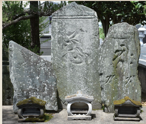
「清見寺心字座板石塔婆」(中央)