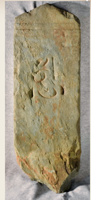
「香林寺心字座板石塔婆」(東松山市埋蔵文化財センター寄託)

市内には少し変わった板碑※(板石塔婆)があります。仏像は蓮の花をかたどった蓮台(蓮座・蓮華座ともいう)に安置されますが、板碑に表された仏や菩薩などを表す種子も蓮台の上に安置されます。しかし、市内には蓮台の部分が蓮の花ではなく『心』という漢字に見えるものが存在します。このことからこれらは「心字座板石塔婆」と呼ばれるようになりました。とても数が少なく、市内だけで3基あるのはたいへん珍しいです。