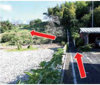
表参道からの入口

『判官塚由来』碑には「建保六(1218)年頃岩殿山に居た能員の孫、 かすしげ 員茂は、観音堂の東南の地、南新井に塚を築き、能員の菩提を吊った」と記されています。現在の場所は、大東文化大学キャンパス開発造成工事に伴い移築されたものです。門前町の雰囲気味わいながら、歩いて訪れるのがおすすめです。