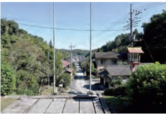
岩殿観音正法寺からの表参道