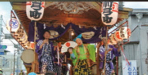
箭弓町祭りばやし保存会