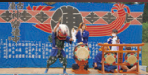
古凍祭りばやし保存会