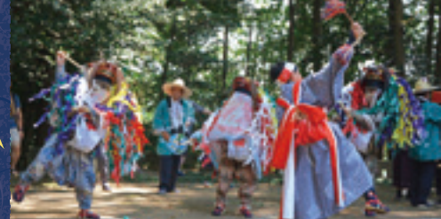
下唐子獅子舞保存会