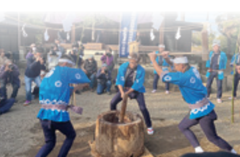
金谷餅つき踊り保存会