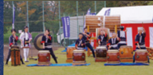
武蔵流東松山太鼓