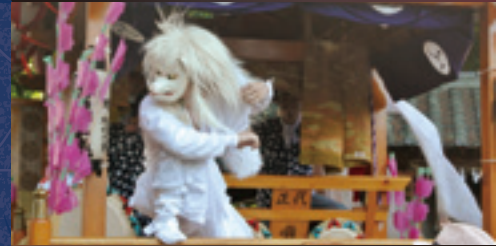
正代祭りばやし保存会