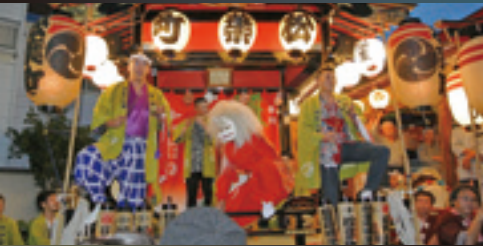
松葉町祭りばやし保存会