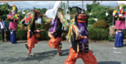
上野本獅子舞保存会