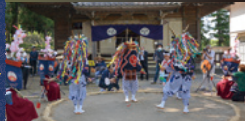
神戸獅子舞保存会