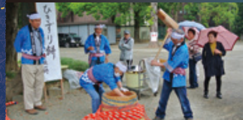
東平ひきずり餅保存会