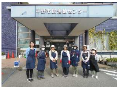
フラワーサポーター7名

今年、フラワーサポーター7名の協力と地域支援課、平野市民活動センター職員合計11名で、3ヶ所の花壇に約400株の花の苗を定植しました。