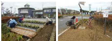
センター内花壇に植付け