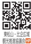
東松山・比企広域観光推進協議会HP

日11月1日(金)から予定枚数終了まで 場東松山駅観光案内所、市観光協会ほか 内松山城跡の御城印販売を記念して国指定史跡比企城館跡群4城揃い踏みキャンペーンを実施します。松山城跡、菅谷館跡、杉山城跡、小倉城跡全ての御城印を購入手した人に、特別御城印を差し上げます(限定400枚)。 ※特別御城印はなくなり次第終了となりますので予めご了承ください。 費松山城跡御城印 500円/枚 問市観光協会 ☎23-3344 FAX23-7775