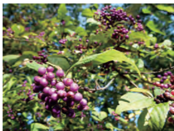
異端児ムラサキシキブ