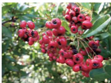
つややかなピラカンサ