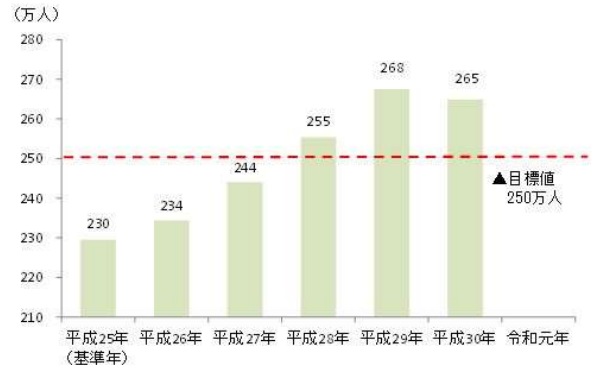
▲東松山市の観光入込客数

第二次計画の期間は令和 2 年度から令和 7 年度までの 6 年間とし、市を訪れる観光客の増加を図ることで、将来的に市に住む方の増加につなげていくとともに、市民も楽しめる観光のまちづくりを進めていきます。