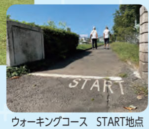
ウォーキングコース START地点

五領町近隣公園 ～健康遊具やウォーキングで健康増進～ 芝生広場や遊具広場の周囲に1周500メートルの長めのウォーキングコースがあります。コース沿いにイチヨウやサザンカの植栽があり、新緑・紅葉・花など季節を感じながらウォーキングが楽しめます。8種類の健康遊具もあり、広々とした解放感ある公園です。 場五領町8番 駐25台