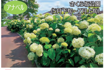
アナベル さくら坂公園 (5月下旬～7月上旬) 場高坂840番