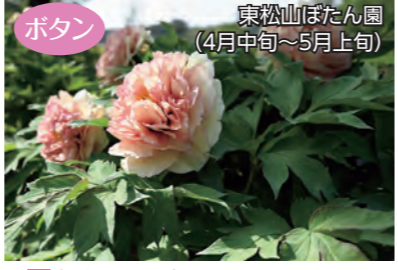
ポタン 東松山ぼたん園 (4月中旬～5月上旬) 場大谷1148番1