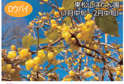
ロウバイ 東松山ぼたん園 (1月中旬～2月中旬) 場大谷1148番1