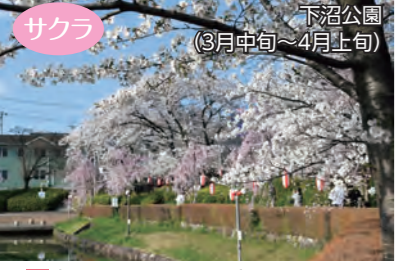
サクラ 下沼公園 (3月中旬～4月上旬) 場本町二丁目5187番1