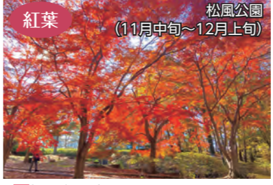
紅葉 松風公園 (11月中旬～12月上旬) 場松風台7番