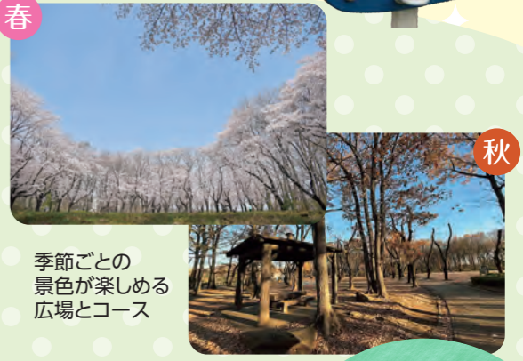
季節ごとの景色が楽しめる広場とコース

市民の森 ～木漏れ日の中をお散歩できる～ 長さ10センチほどある大きな松ぼっくりがなるテーダマツの木があります。木漏れ日の中をのんびりお散歩しながら、松ぼっくりやどんぐりが探せます。舗装された園路と自然を感じられる尾根道の散策路があり、野鳥の声に耳を傾け、マイナスイオンを浴びながらの散策は最高です。 場岩殿1738番1 駐90台