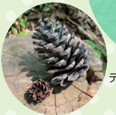
テーダマツの松ぼっくり