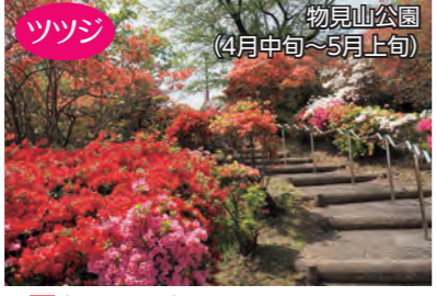
ツツジ 物見山公園 (4月中旬～5月上旬) 場岩殿241番17