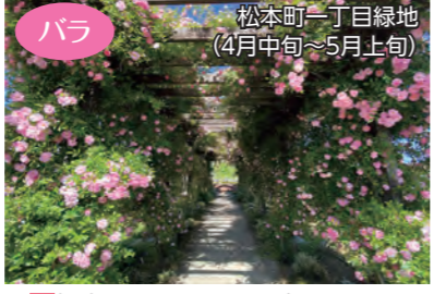
バラ 松本町一丁目緑地 (4月中旬～5月上旬) 場松本町一丁目4695番4