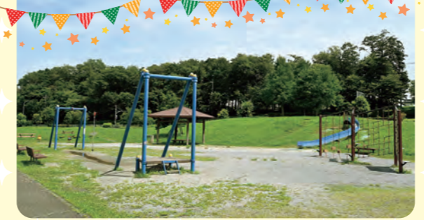
ローラーすべり台など、遊具がたくさん!

折本山公園 ～遊具や広い芝生で遊べる～ ローラーすべり台、クライミング遊具、ターザンロープなどの遊具があり「わんぱく」な子どもたちも大満足できる公園です。広い芝生や洋風あずまやもあるので、お弁当を持って遊びに行くのもオススメです。 場あずま町四丁目6番 駐10台