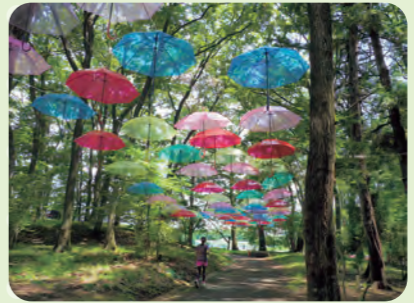
アンブレラスカイ(7～8月)

岩鼻運動公園 ～スポーツ施設と自然が融合～ 陸上競技場、サッカー場、野球場、テニスコート。スポーツ施設がたくさんある公園です。陸上競技場の南側にある1周500メートル強のコースは木々に囲まれ、春はサクラ、秋には紅葉を楽しみながらジョギングやウォーキングを楽しめます。 場松山2681番ほか 駐420台