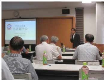
市長による市政報告

7月22日(月)午後6時から市長による市政報告が行われました。冒頭に市長より市制施行70周年の説明があり、その後東松山市全般の予算の概要、産業振興、観光振興、子育て支援、防災・減災対策、地域福祉の充実等について説明がありました。その後、野本地区ハートピアまちづくり協議会メンバーと市長との意見交換が行われ、質疑が4件出されました。 シニア世代の健康増進や自治会未加入者の問題などを市長が回答しました。