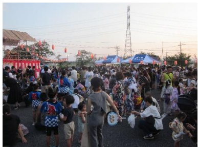
大勢の人が訪れました。