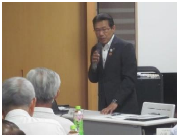
質疑に回答する森田市長