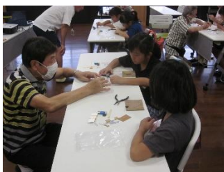
クリップモーター作り

令和6年8月19日(月)午前10時〜午前11時30分 野本市民活動センターに於いて、2回目の子ども 理科教室を開催しました。小学生10名が参加しま した。今回は「クリップモーター」を製作しました。 乾電池と永久磁石、クリップを加工してモーターを 作りました。 乾電池に通電させるとコイル線がくるくる回りま した。モーターを製作することでモーターの構造と 基本原理を勉強しました。