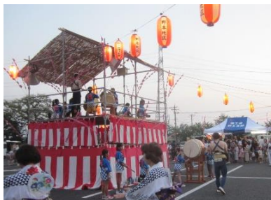
小学生による盆太鼓演奏