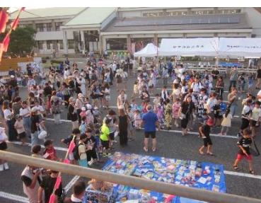
小学生以下のビンゴ大会