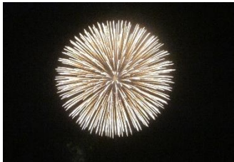
綺麗な花火が上がりました。

8月17日(土)午後7時から都幾川リバーサイドパークで、第25回ひがしまつやま花火大会が開催されました。63品目の企業や団体・個人から協賛して頂いた花火が盛大に打ち上げられました。約1時間半の間、華麗な花火が観られました。