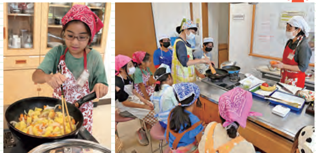
7月29日(月)・30日(火)、野本市民活動センターで小学4~6年生対象のこどもクッキングを開催しました。栄養士さんから作り方を教わり、魚のソテーや肉じゃがなどを協力して調理。自分たちで作ったご飯はとってもおいしく「家でも作りたい!」「楽しかった!」とたくさんの笑顔が見られました。