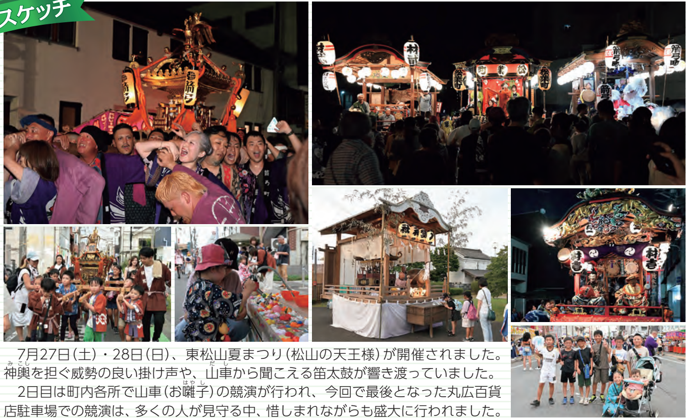
7月27日(土)・28日(日)、東松山夏まつり(松山の天王様)が開催されました。神輿を担ぐ威勢の良い掛け声や、山車から聞こえる笛太鼓が響き渡っていました。2日目は町内各所で山車(お囃子)の競演が行われ、今回で最後となった丸広百貨店駐車場での競演は、多くの人が見守る中、惜しまれながらも盛大に行われました。