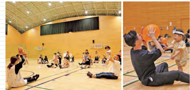
8月3日(土)、南地区体育館でお父さんと遊ぼう会を開催しました。参加した21組57人の親子は、リズム体操やお面作りなどに挑戦。アットホームな雰囲気の中、触れ合いを通して、親子の笑顔がたくさん見られました。次回は11月9日(土)に市民体育館で開催予定です。ぜひお越しください。