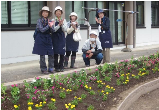
フラワーサポーター5名で植付しました。

令和6年5月30日(木)野本市民活動センター内の花壇に、夏の花を定植しました。今年花いっぱいサポーター5名の協力と地域支援課2名、野本市民活動センター地域活動推進員の合計8名で5ヶ所の花壇に、マリーゴールド、百日草、ナデシコ、オステオスペルマムなど約700株の花の苗を定植しました。7月、8月にかけて成長し綺麗な花が咲きます。