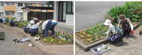
センター内花壇5ヶ所に花の苗を定植