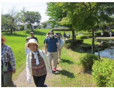
七清水せせらぎ緑道を歩行

6月の月例ウォーキングは、高坂七清水せせらぎ緑道のコースに119名が参加しました。野本市民活動センターを出発時点で気温が高く、熱い中でのウォーキングになりました。途中3回の水分補給の休憩を取り、約6キロのコースを2時間で完歩しました。