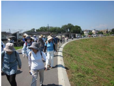
あずま町北側の堤防を歩行