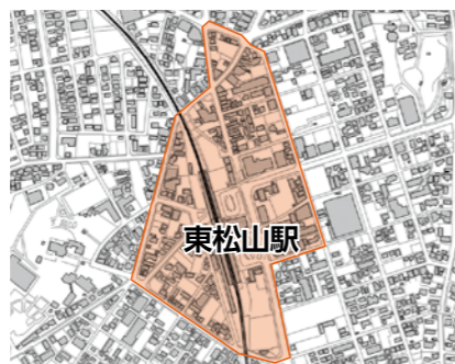
東松山駅周辺指定区域